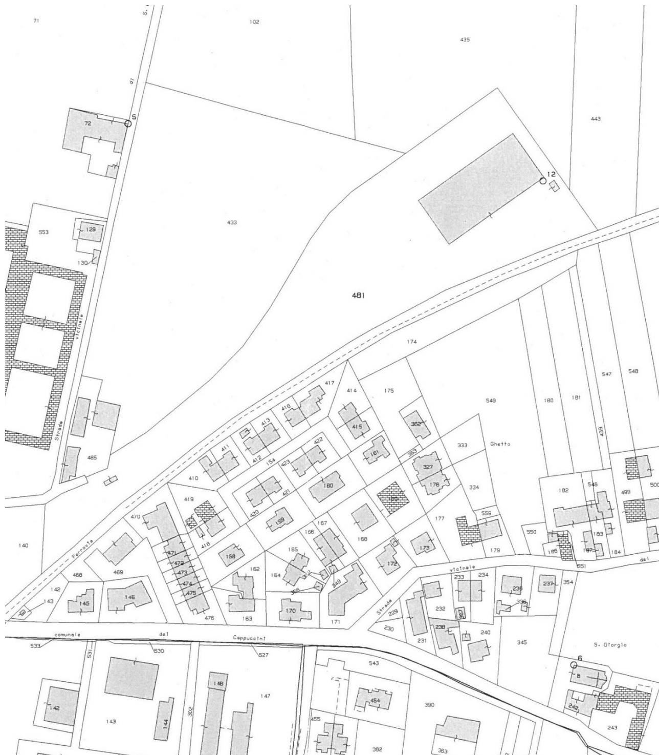
Estratto Mappa – Comune di Guastalla, foglio 10, mappale 481.

Allo stato attuale presso la Ferrovia Parma-Suzzara a Guastalla in via F. Da Volterra, Foglio n° 10 mappale 481, esiste un fabbricato destinato a officina meccanica per la manutenzione del materiale rotabile (treni).